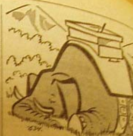
... till inte där och gör... ...människa... ...634