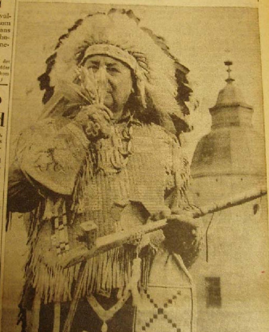
Indianhövdingen Stora Vita Ugglan i praktfull fjäderskrud och med Kalmar slott som efter- full bakgrund njuter av liljekonvaljens doft.