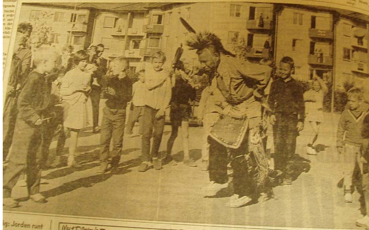
...g: Jorden runt